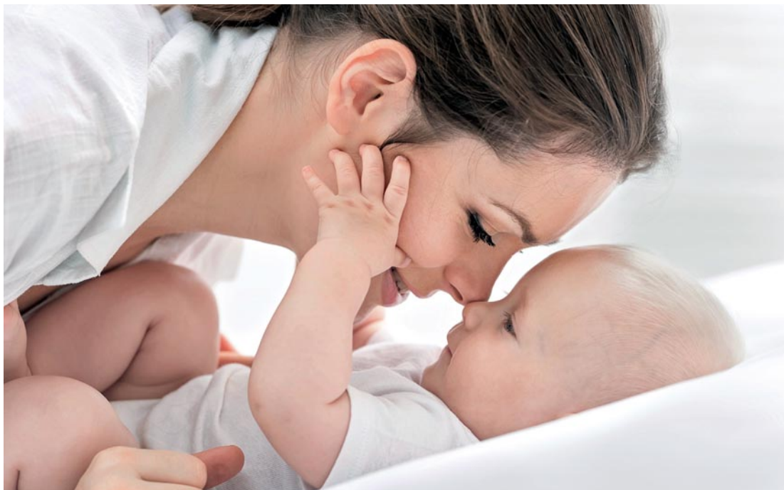
Von einer guten Zahngesundheit der Mutter profitiert das Kind auch nach der Geburt.