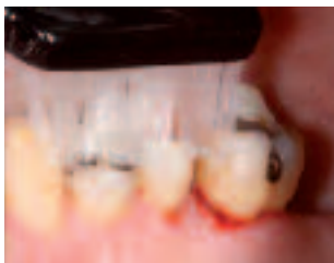
Blutet das Zahnfleisch beim Zähneputzen, ist dies das sichere Zeichen einer schwelenden Entzündung. Bei Zahnfleischbluten handelt es sich nicht um eine Verletzung, etwa mit der Zahnbürste, sondern um eine Reizung von entzündetem Gewebe.