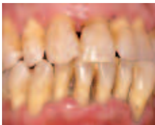
Ohne Behandlung kann im Laufe von wenigen Jahren aus der leichten Parodontitis dieses schwere Krankheitsbild entstehen: Eitrige, schmerzhafte Abszesse, gelockerte und gewanderte Zähne (Lückenbildung).

Parodontitis wird durch schlechte oder falsche Mundhygiene begünstigt. Der Krankheitsverlauf und die Anfälligkeit des Zahngewebes für schädliche Bakterien können durch Faktoren wie ein geschwächtes Immunsystem, starkes Rauchen, Diabetes und andere allgemeine Erkrankungen beeinflusst werden. Parodontitis erhöht umgekehrt das Risiko für Herz-Kreislauf-erkrankungen, Frühgeburten oder Atemwegserkrankungen und kann einen bestehenden Diabetes negativ beeinflussen.